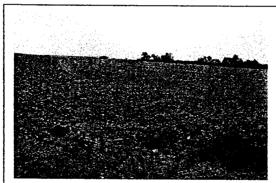
Vue de la parcelle à drainer depuis le chemin de Pitgam

La parcelle à drainer est située à 2,5 km au nord-ouest de la commune de Zegerscappel. Elle est longée au nord par le chemin de Pitgam. Sa superficie est de 10,6634 ha. L'exutoire de cette parcelle est un fossé situé au nord de cette parcelle, qui déverse ses eaux dans le ruisseau d'Eringhem, à 500 m à l'ouest.