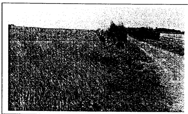
Vue du casier depuis le chemin rural (intersection avec la VC du Petit Paradis)

Le casier longe la VC du Petit Paradis au nord et un chemin rural à l'ouest.