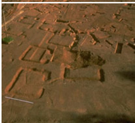
Bibracte, vue de la nécropole de la Croix du Rebut, Tène finale-époque augustéenne, 1998