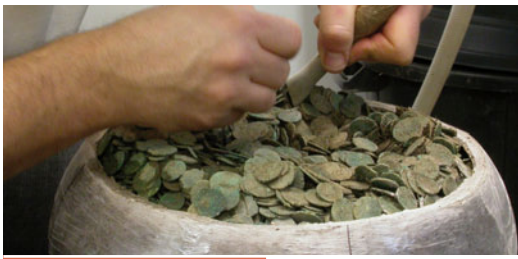
Fouille en laboratoire d'une cruche remplie de monnaies du IIe s. ap. J.-C. (Pannecé, Loire-Atlantique)

Les archéologues professionnels collaborent avec des spécialistes de nombreuses disciplines pour inventorier, étudier puis replacer dans un contexte historique les traces parfois ténues mais toujours significatives de l'histoire des hommes. La publication scientifique et la valorisation des résultats auprès du grand public sont les objectifs majeurs de la profession car toute intervention sur un site archéologique implique la destruction, par l'étude raisonnée, des vestiges de nature diverse enfouis dans le sol.