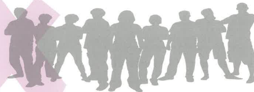
Le violentomètre un outil qui permet d'évaluer sa relation de couple.

Si tu doutes de la portée exacte de ce qui se passe, sache qu'il existe des choses, des actes, des comportements qui doivent avoir une résonance particulière et qui doivent alors clignoter tels des feux d'alerte. Ne pas déceler ou sous-évaluer ce qui est inacceptable pourrait te conduire à banaliser les violences et amener à des situations dramatiques pour toi, pour ton conjoint et tous ceux qui tiennent à toi.