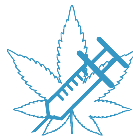
AUTRES FAITS DE DÉLINQUANCE