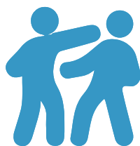
ATTEINTES VOLONTAIRES À L'INTÉGRITÉ PHYSIQUE