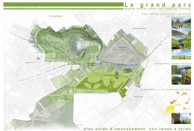
A droite : photo du site aujourd'hui. A gauche : plan du projet (ILEX)