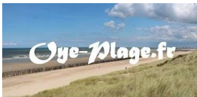
Le site officiel de la commune d'Oye-Plage (62215)